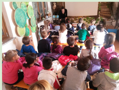
A LEZIONE CON GLI ESPERTI