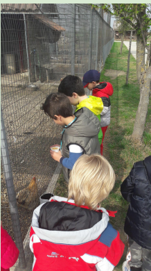
ATTIVITA' A CONTATTO CON LA NATURA