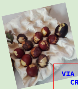
VIA LIBERA ALLA CREATIVITA'